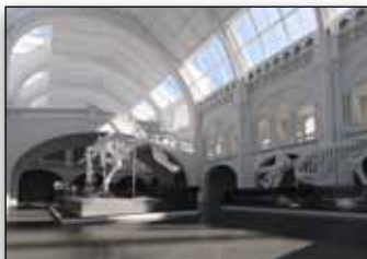
Visualisierung von Projektentwürfen