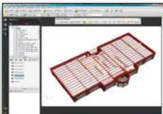
Erstellung intelligenter 3D-PDFs