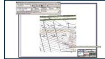
Automatische Erzeugung Zeichnungen des Lage- und Höhenplans sowie der Querprofile

Wenn z.B. eine Geländeoberfläche geändert wird, verwenden Sie einfach den Befehl "Querschnitt aktualisieren". Damit entfällt das lästige Manipulieren von Grafik und Beschriftung.