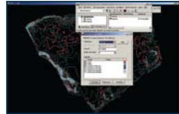
Höhenlinien können auf einfache Weise mit Intervallen dargestellt werden

Längs- und Querschnitte können einfach entlang einer Trasse, eines grafischen Elementes oder über beliebig festgelegte Punkte erzeugt werden. Bentley InRoads bietet hervorragende Funktionen zum Erzeugen, Bearbeiten und Beschriften von Längs- und Querschnitten. Querneigungsbänder, Krümmungs- und Steigungsband sowie alle anderen Entwurfsdaten gehören zu den vielfältigen Darstellungsoptionen. Querschnitte lassen sich an beliebigen Zeichnungspositionen über Stationen, Einzelpunkte oder vom Benutzer definiert RE-gerecht erzeugen. Sie werden innerhalb eines