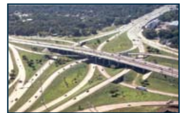
Fotorealistische Darstellung eines Autobahnknotens

Bentley InRoads Site ist Bestandteil dieses Produktes.