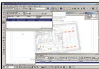
Maßgenaues Referenzieren von Bestands- daten aus Raster- oder Vektordateien