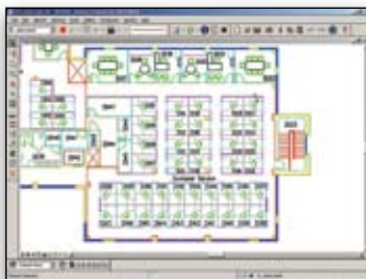
Leistungsstarke Funktionen für Pläne und technische Dokumentationen.