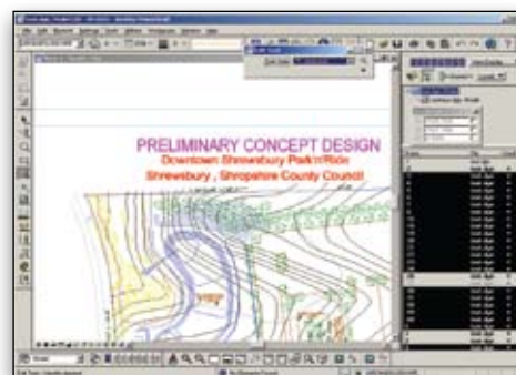
Individuelles Einstellen von Oberfläche und Paletten