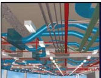
Teilansicht eines gewerkeübergreifenden BIM Modells

Für die Berechnung von Querschnitten können Kanal- und Rohrleitungssysteme auf Anschlusskonsistenz und Durchflusswege analysiert werden. Kundenspezifische Bauteile, Kanäle und Zubehör können zudem mit Visual Basic for Applications (VBA) erstellt werden. Die Schnittstelle zu CAMDuct (M.A.P.) liefert darüber hinaus einen nahtlosen Übergang von der Planung bis zur Kanalherstellung.